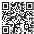
für Android Geräte

QR-Code scannen und direkt in unsere App gelangen!